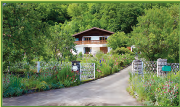
Dans son écrin de verdure la maison s'entoure de fleurs, entrez, c'est ouvert... En face, notre belle vallée s'offre à vous !